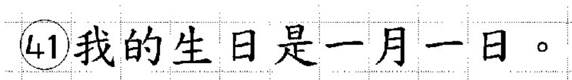
Рис. 22. Образец написания иероглифических знаков

Бланк ответов № 2 (лист 1 и лист 2) по китайскому языку (рис. 20, 21) предназначен для записи ответов на задания КИМ для проведения ЕГЭ с развернутым ответом по китайскому языку (строго в соответствии с требованиями инструкции к КИМ для проведения ЕГЭ и к отдельным заданиям КИМ для проведения ЕГЭ). Каждый иероглифический знак и каждый знак препинания следует писать внутри отдельной клетки в поле ответов бланка ответов № 2 (ДБО № 2) (рис. 24).